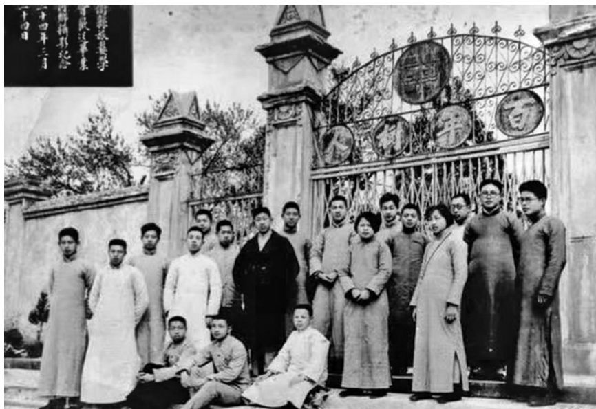
/ 原浙江省第七中学旧址图