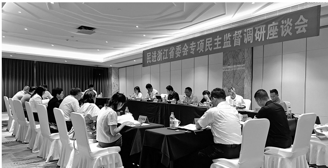
民进省委会在台州召开“切实推动营商环境优化提升‘一号改革工程’”专项民主监督调研座谈会。