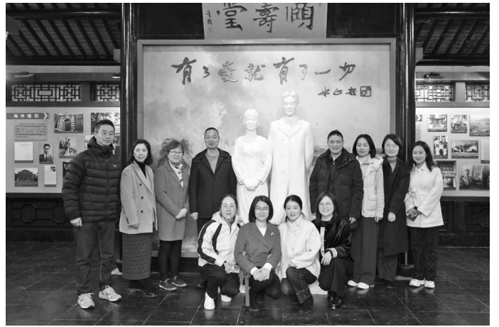
3月4日至7日,民进宁波市委赴常州、无锡、苏州、嘉兴等地开展主题年工作和自身建设专题调研。图为调研组在吴文藻冰心纪念馆合影。