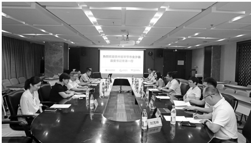
2023年7月27日上午,浙江省政协副主席、民进浙江省委会主委蔡秀军在浙江大学医学院附属邵逸夫医院会见来访的贵州省毕节市金沙县委书记李涛一行。