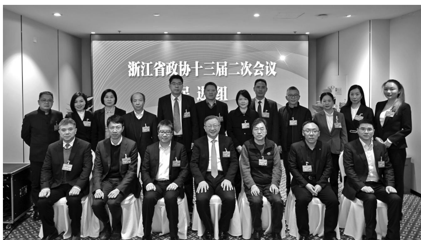
/ 民进界别组委员合影

两点感受:一是政协落实发展全过程人民民主、协商民主重大战略,印象深刻;二是政协助力高质量发展有力有效,“六送下乡”活动广受欢迎。两点建议:一是做好省政协重大课题的跟踪反馈,加大