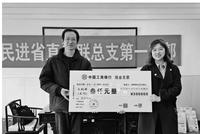
3月5日是学雷锋纪念日,民进省直二联一支部举办活动,助力“浙阿对口支援”事业。