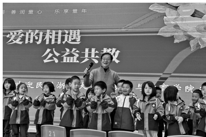
近期,民进浙师大儿童教育与发展学院支部与新昌幼教集团联合开展“爱的相遇·公益共教”活动。