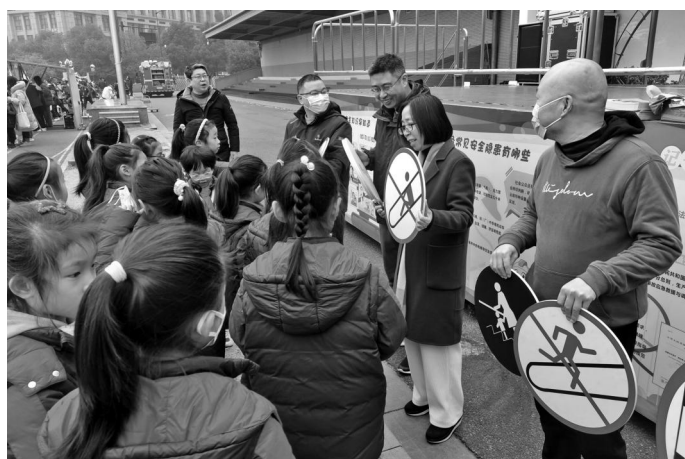
新年伊始,民进省特科院支部走进杭州天地实验小学开展特种设备科普宣传。