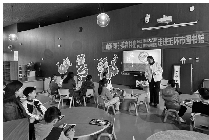
元宵节前,民进浙江科技大学支部、民进台州玉环市基层委员会在玉环市图书馆联合开展“山海同行·美育共富”亲子公益活动。