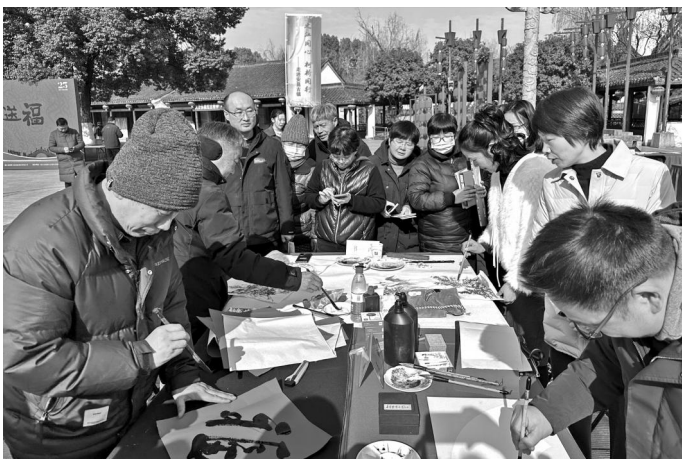
1月26日,民进绍兴市柯城区基层委员会开展甲辰(2024)民进“春联万家·向‘新’而行”活动。