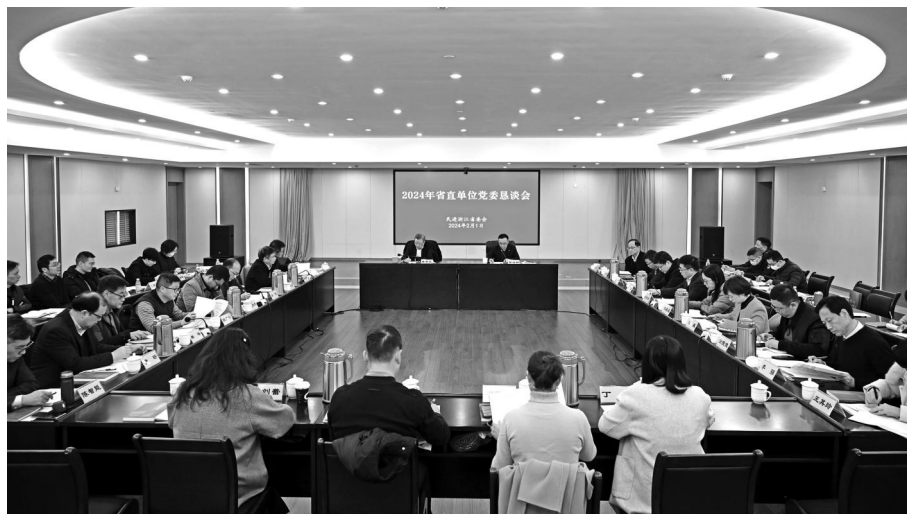
2月1日,民进浙江省委会召开2024年省直单位党委恳谈会。浙江省政协副主席、民进浙江省委会主委蔡秀军出席会议并讲话,省委会专职副主委薛鸿翔主持会议;20余家省直单位党委、统战部负责人参加会议。