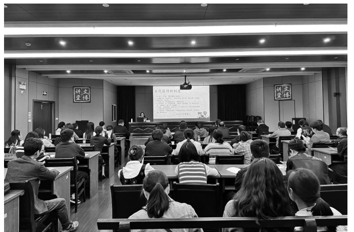
3月23日,民进东阳市基层委员会参与主办的“之江同心·黄门讲堂”首讲暨“民进学堂”第二期活动在东阳市博物馆举行。