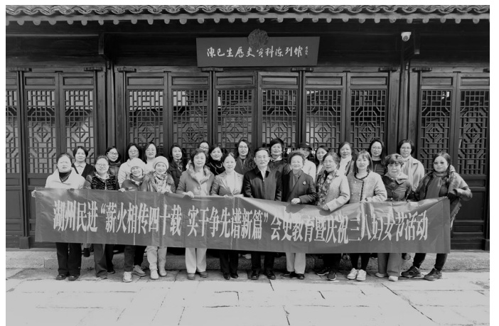
3月7日,民进湖州市委会组织女会员赴嘉兴海宁开展“薪火相传四十载 实干争先谱新篇”会史教育暨庆祝三八妇女节活动。