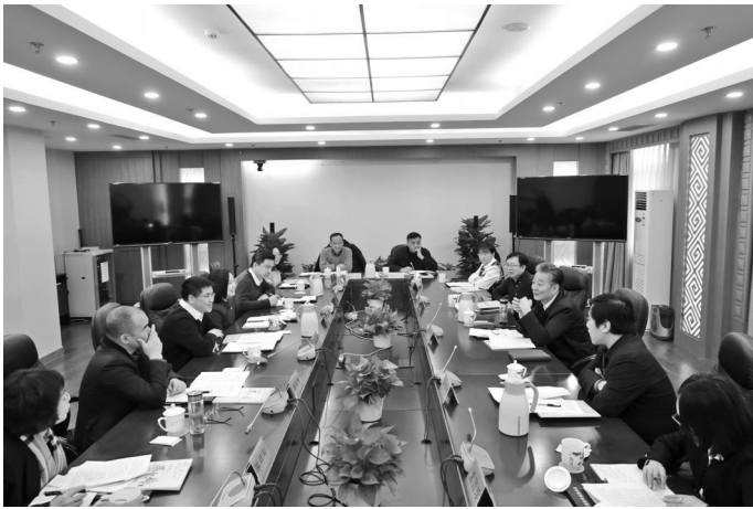
2月29日,民进浙江省委会副主委、杭州市委会主委楼秀华带队赴民进中央汇报工作。民进中央副主席王刚在民进中央机关会见楼秀华一行。