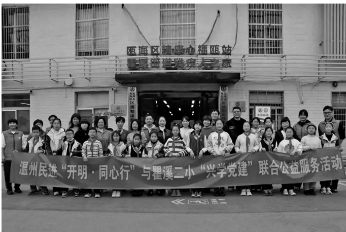
3月5日,温州民进携手瓯海区瞿溪二小在瞿溪街道“残疾人之家”开展公益活动。