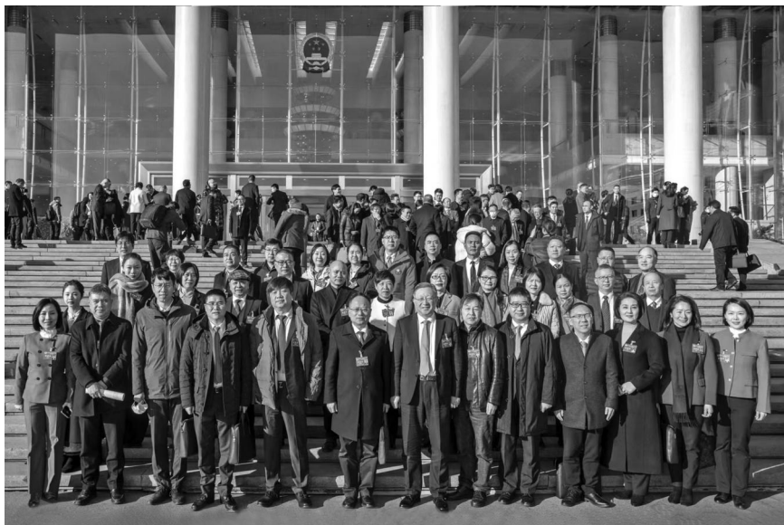
/ 参加2024年省两会的部分委员、代表合影

纽和高能级开放强省》《大力提高政府产业基金使用效率,助力浙江特色现代化产业体系建设》《推进政务增值化改革,助力我省打造一流营商环境》《推动新型公共阅读空间建设,创新高品质文化生活机制》《推动我省慈善事业高质量发展,为共同富裕注入新动能》8件团体提案;《加强医工信交叉融合力度,推动我省卫生健康事业高质量发展》《加快推动环境式沉浸式戏剧健康发展,为中华